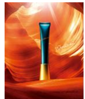
リンクルショット メディカル セラム

香港：Harvey Nichols Landmark, Central / Harvey Nichols Pacific Place, Admiralty / Beauty Bazaar The One, Tsim Sha Tsui / SOGO, Tsim Sha Tsui / Times Square, Hong Kong