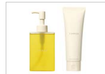
2月発売 THREE 「balancing」シリーズ