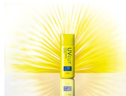
5月末発売 オルビス 「サンスクリーンスーパー」