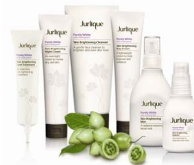
Jurlique 「Purely White」