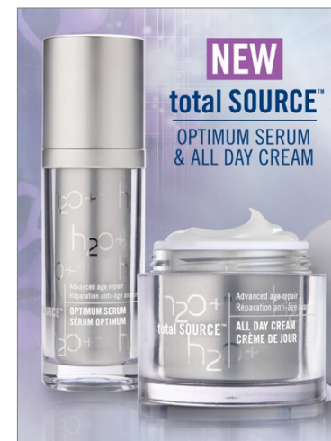
2月発売 H2O PLUS 「total SOURCE OPTIMUM SERUM & ALL DAY CREAM」