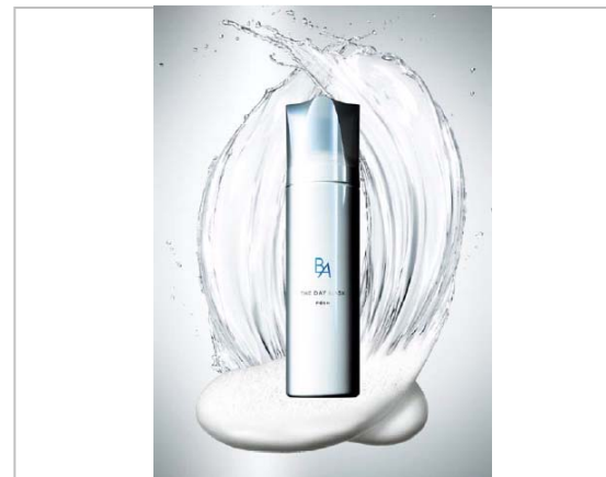
5月発売 ポーラ 「B.A ザ デイマスクS」