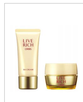
2月発売 オルビス 「ライブリッチ」