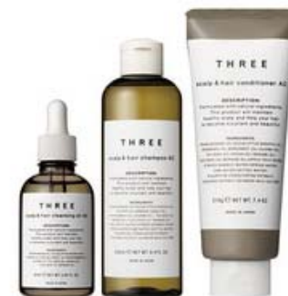
7月発売 THREE 「スカルプ&ヘア」