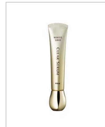
2月発売 ポーラ 「ホワイトショット クリアセラム SX」