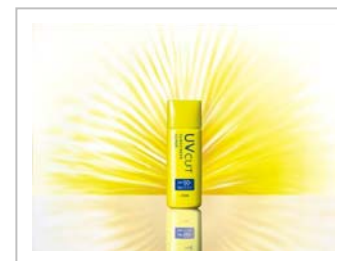
5月末発売 オルビス 「サンスクリーンスーパー」