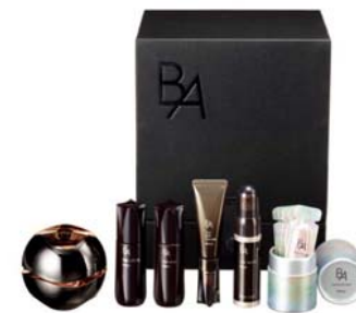
11月発売 ポーラ「B.A. プレミアムコレクション」