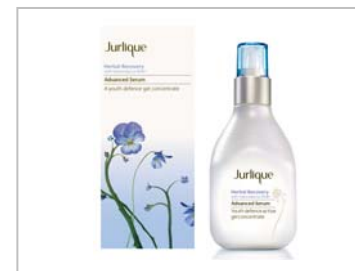
9月発売 Jurlique 「Herbal Recovery Advanced Serum」