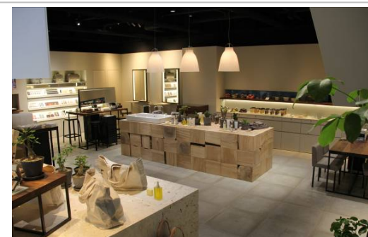
10月3日オープン 「THREE AOYAMA」