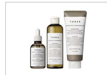
7月発売 THREE 「スカルプ & ヘア」