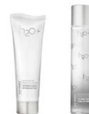
10月発売 H2O+ 「totalSource Optimum Cleanser & Optimum Toner」