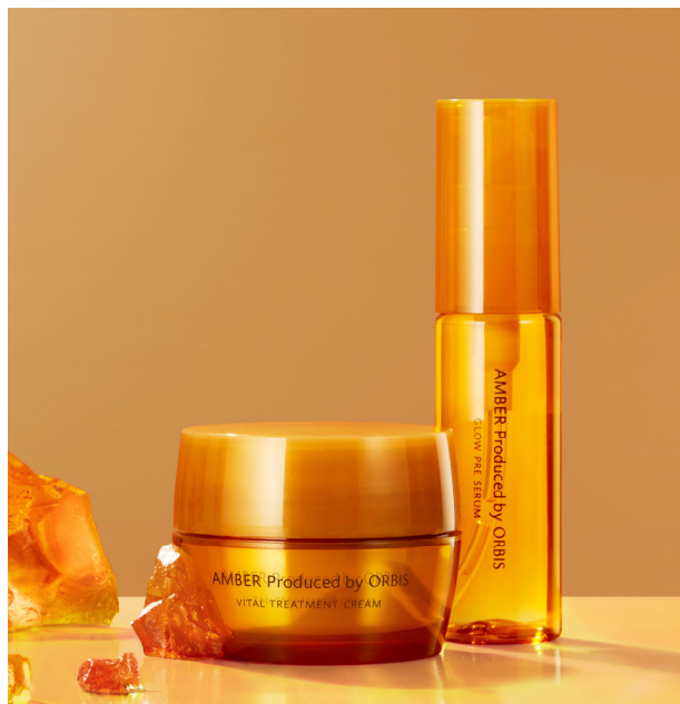
シニア世代への コミュニケーション強化