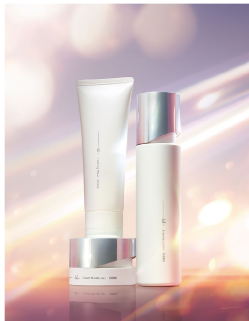
付加価値の高いスキンケアを軸に ブランド価値向上