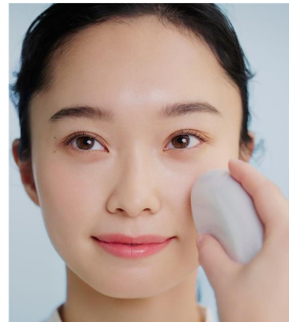
パーソナルなコミュニケーション の強化