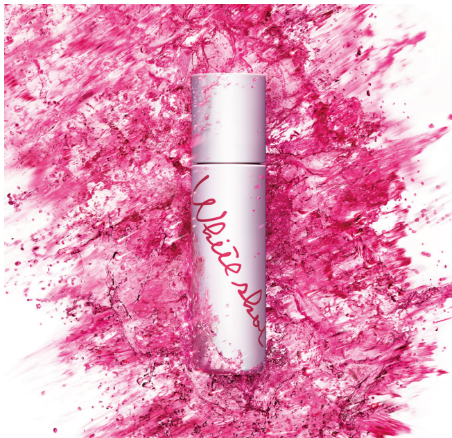
シミ・シワ領域の強化