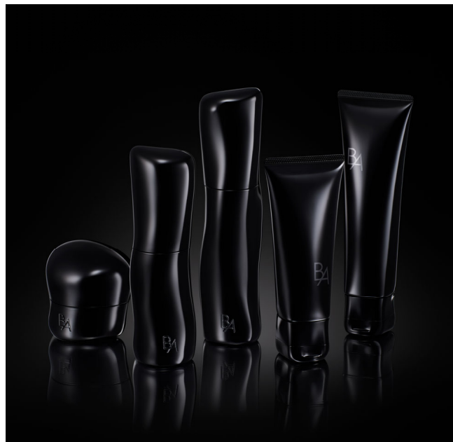
B.Aスキンケア フルリニューアル