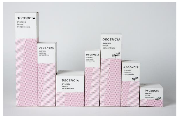
新オフィシャルモチーフを採用した外箱パッケージ

コーポレートロゴと同じく、「胸を張って生きていく」ことを強くイメージしました。少し離れて見ると、線で形成されたスラッシュは面へと変わってゆき、色面による新たなスラッシュが浮かび上がるようになっています。