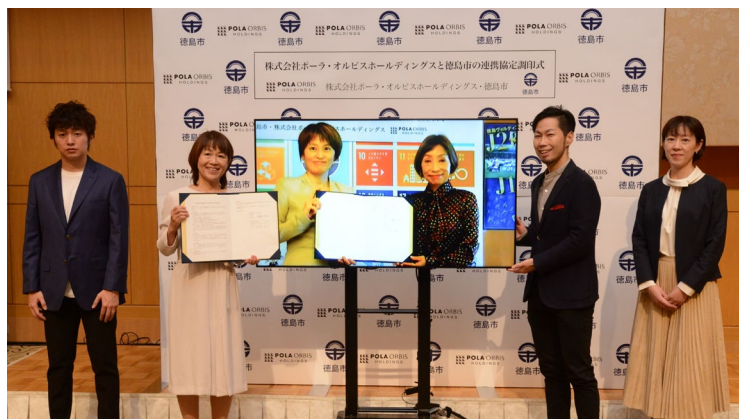
横浜の会場と徳島市役所をウェブ会議システムで結び調印式を実施

※2 「ポーラ化成、ウェルネステックプロジェクト“me-fullness”をスタート」(2021年7月2日) http://www.pola-rm.co.jp/pdf/release_20210702.pdf