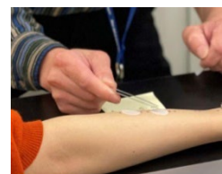
図3. 温泉水を含ませたろ紙を腕に置く様子

皮脂成分の一つであるオレイン酸を付着させたろ紙を 41℃の温泉水または精製水に 16～18 時間浸し、その後ろ紙に残った油分を染色・観察します。不要な皮脂は肌トラブルの原因となるため、適切に取り除く必要があります。