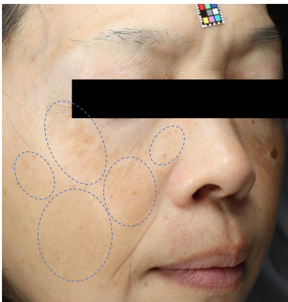
図 2. 複合ケア群（LT施術とルシノール®配合製剤の併用）の代表例