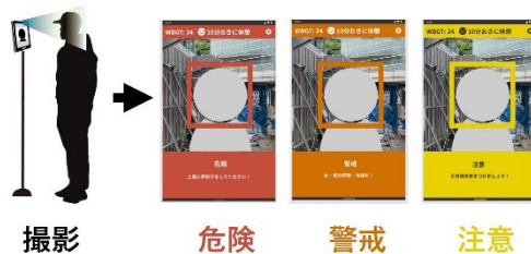
図1. AIカメラ判定システム(イメージ)

現場監督者は、PC やスマートフォンで現場全体の状況を把握して適切な対策を打てます。